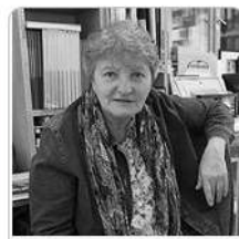
Fotografka Lenka Hoffmannová