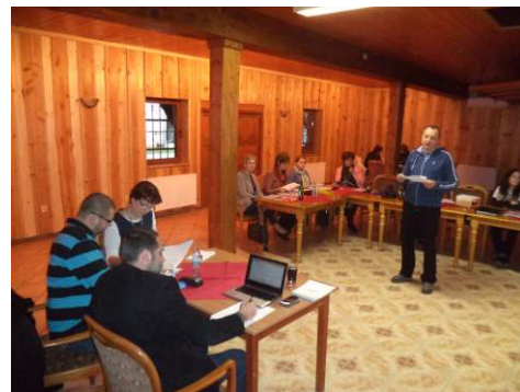
Představování podnikatelských plánů před projektovou porotou.

Pro bližší informace o projektu můžete navštívit facebookové stránky projektu https://www.facebook.com/sancepromoravskoslezskykraj nebo webové stránky realizátora projektu http://www.cpkp.cz/index.php/program-y-mrsk/189-bec-pro-moravskoslezsky-kraj .