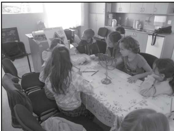
Fotografie byly pořízeny na besedě pořádané sdružením Respekt a tolerance k příležitosti výstavy s názvem „Vzpomínka na rodinu J. Wolfa“