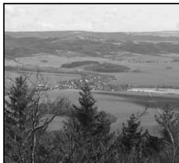
Pohled na Dolní Libinu z Bradla

Zvolené místo bylo pro umístění palírny výhodné a strategické. Jednak bylo při křížení dopravních cest Šumperk – Rýmařov – Uničov – Úsov, jednak bylo v blízkosti zdroje pitné vody, která je v technologii destilace a výroby likérů podstatná. Rovněž charakter krajiny umožnil bohatou ovocnářskou produkci. Ovoce zde bylo vypěstováno, zpracováno a konzumováno. Provozovna byla na okraji obce a tak kouř, který vznikal při výrobě, nikoho nerušil.